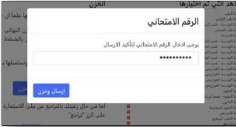
الشكل رقم (١٣) إدخال الرقم الإمتحاني لتأكيد الإرسال

وبعد كتابة الرقم الإمتحاني لتأكيد الإرسال والضغط على الزر (إرسال وخرن) سيتم إرسال خيارائك وخرنها ويتم اعتماد الإستمارة بشكل نهائي . في حال نجاح الخزن ستظهر لك الرسالة الموضحة في الشكل (١٤) لتمتلك من سحب الوصل (إستمارة التقديم الإلكتروني) الخاص بك والمثبت فيه إختياراتك المخزونة.