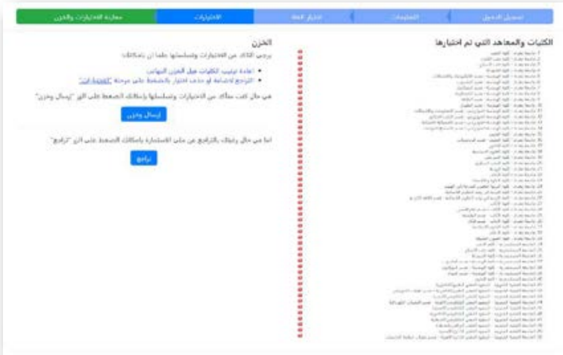
الشكل رقم (١٢) معاينة الإختيارات والخرن

تم إنشاء الصفحة الموضحة في الشكل رقم (١٢) أعلاه لمعاينة الإختيارات التي ملأها الطالب في الخطوة السابقة قبل الإرسال والخرن النهائي لتسهيل الإجراءات على الطالب وإعطاء فرصة أخرى لتبديل خياراته او تعديلها.