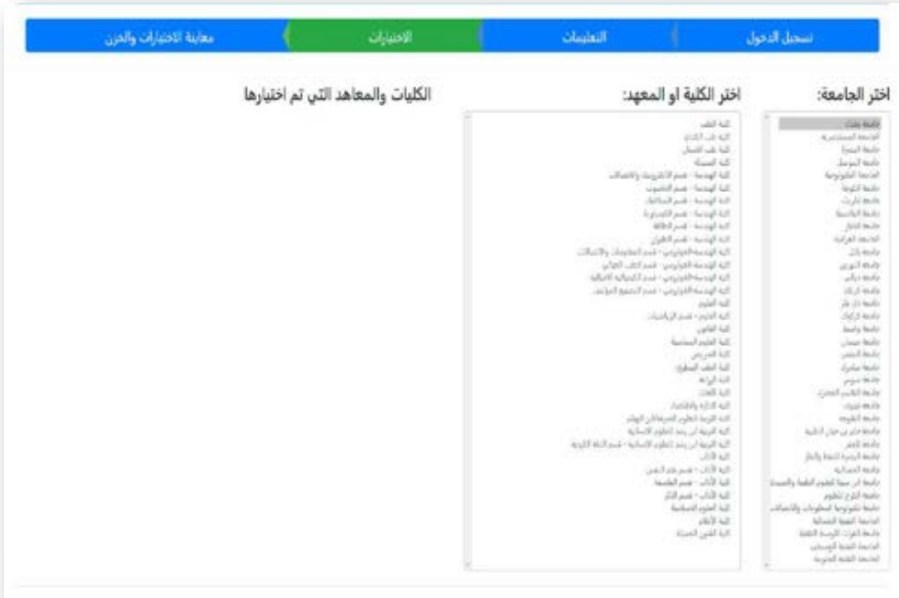
الشكل رقم (٧) الصفحة الخاصة بتحديد الإختيارات

وبعد الضغط على زر (الإختيارات) من شريط مراحل الملء سوف تظهر الصفحة الخاصة بتحديد الإختيارات كما في الشكل رقم (٧).