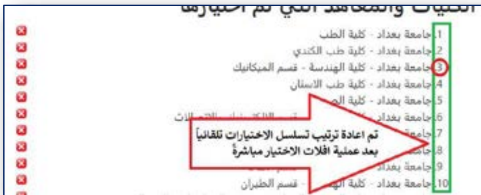
الشكل رقم (١١) إعادة ترتيب الإختيارات تلقائياً