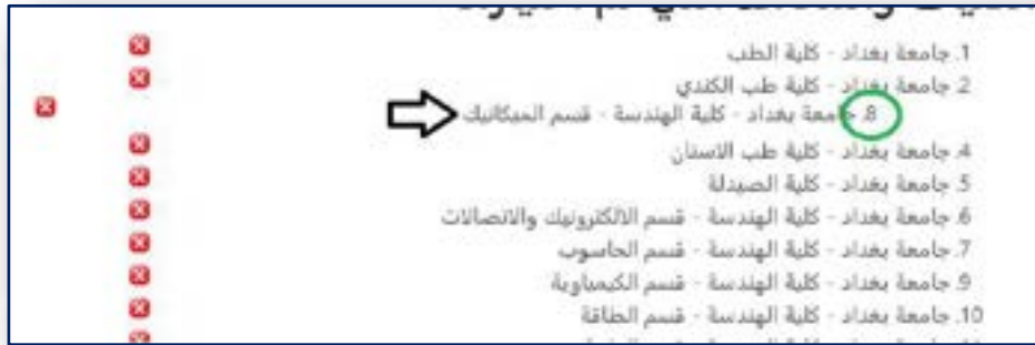
الشكل رقم (١٠) سحب الإختيار المراد تغييره الى التسلسل المطلوب