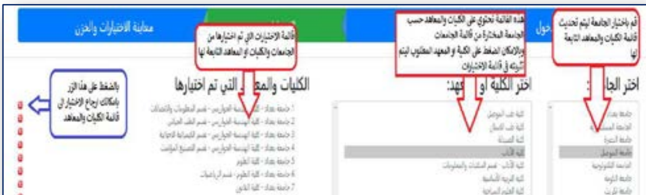
الشكل رقم (٨) قائمة باسماء الجامعات والكليات والمعاهد التي تم إختيارها من قبل الطالب

وهي أهم صفحة ، لذلك يجب عليك عزيزي الطالب الإنتباه جيداً الى كيفية تحديد إختياراتك والدقة في تثبيت إختيار صحيح على حسب الترتيب الذي ترغب به ، تم تصميم هذه الصفحة بشكل مبسط وسهل إذ تحتاج فقط إختيار اسم الجامعة التي ترغب بإختيار كلية او معهد منها لتظهر لك قائمة بجانبها تتضمن الكليات والمعاهد التابعة لهذه الجامعة وكما هو مبين بالشكل رقم (٨).