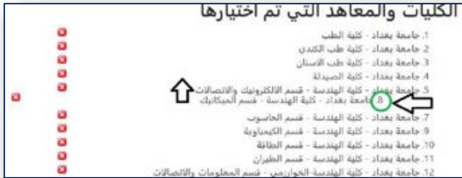
الشكل رقم (٩) تغيير تسلسل الإختيار