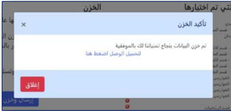
الشكل رقم (١٤) تحميل إستمارة التقديم الإلكتروني

وبعد كتابة الرقم الإمتحاني لتأكيد الإرسال والضغط على الزر (إرسال وخرن) سيتم إرسال خيارائك وخرنها ويتم اعتماد الإستمارة بشكل نهائي . في حال نجاح الخزن ستظهر لك الرسالة الموضحة في الشكل (١٤) لتمتلك من سحب الوصل (إستمارة التقديم الإلكتروني) الخاص بك والمثبت فيه إختياراتك المخزونة.